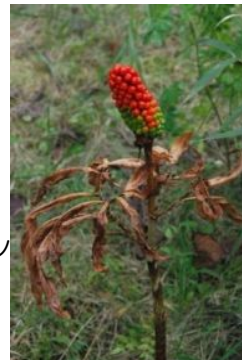
マムシグサの仲間