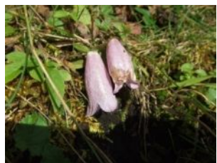
ヤマホタルブクロ