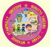
オリジナル缶バッジ