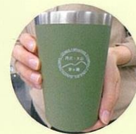
コンビニタンブラー