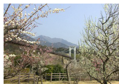
秦野戸川公園のウメ