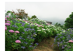
秦野戸川公園のアジサイ