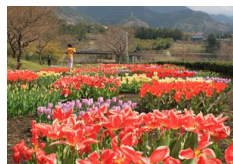
秦野戸川公園のチューリップ