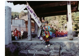
毎年11月23日に行われる実朝まつり。

源実朝公は、甥の公暁(くぎょう)によって殺され、その後、御首(みしるし)は、公暁を討ち取った三浦氏の家来、武常晴(つねはる)らによってこの秦野の地に持ちこまれました。