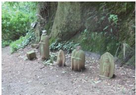
善波峠にある石仏群。

善波峠は秦野市と伊勢原市の境にあり、かつて矢倉沢往還が通っていました。切り通しには6基の石仏があります。その中に1802年(享和2年)の聖徳太子等があります。