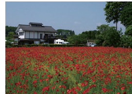
四季折々の花が咲く田原ふるさと公園周辺。

田原ふるさと公園は、地域農業の活性化を図り、人々の憩いの場となることを願って、平成12年に整備されました。