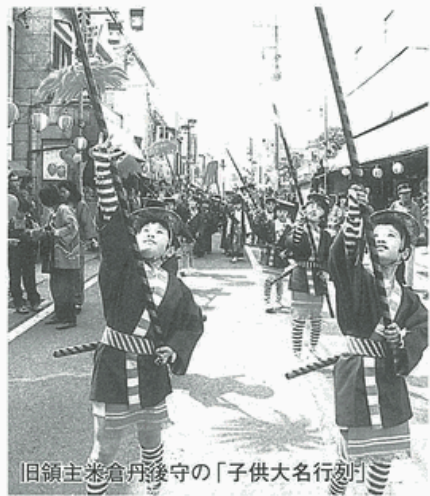
旧領主兼倉丹後守の「子供大名行列」

発式にあわせた無料バスあり。●西中学校へのアクセス・小田急沢沢駅下車、徒歩5分。