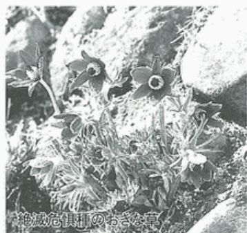
絶滅危惧種のおきな草

の花ともいわれるおきな草。キンポウゲ科の山野草です。3月中旬から下旬にかけて開花し、春を告げる花として知られています。県内では普通に見られる花でしたが、今や絶滅危惧種です。その花を復活させるため、おきな草愛護会が震生湖畔で育てています。花のお披露目を兼ねたお祭りです。●当日は出店やおきな草の直売あり。●アクセス・小田急秦野駅から比奈窪行バス「秦64」所要15分、震生湖下車、徒歩5分。