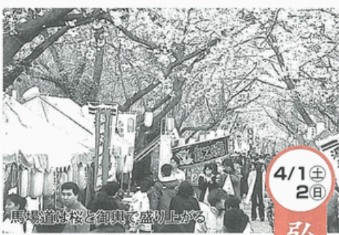
馬場道は桜と御輿で盛り上がる

毎年弘法山公園で行われている「桜まつり」は花見がてらに出かけるにはうってつけ。出店も多数あるので食べ物や片手に様々な行事が見物でき、家族づれからカップルまで大勢の見物客で賑わいます。桜まつりの前後の期間中、夜間は提灯が22時まで点灯されます。夜桜見物と秦野市街地、平塚・厚木方面の夜景も楽しむことができます。●アクセス・小田急秦野駅から平塚方面行バス「平71・平74など」所要10分、河原町下車30分。※4/1(土)・4/2(日)は臨時バスあり。