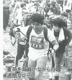
重荷を背負いながらの過酷なレース

丹沢を舞台に、規定の重量(小石)を背負って山を駆け登るといって、日本で唯一のユニークな山岳競技です。秦野戸川公園からスタート、大倉尾根・堀山・花立までの登山コース(全長約12.5メートル、標高差1010メートル)を4区間に分けて1チーム4人で運び上げ、所要タイムを競います。●アクセス・小田急沢沢駅から大倉行バス「渋02」所要15分、終点下車5分。