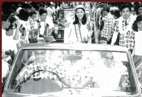
ミスたばこパレード(1970年)