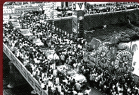
ミスたばこパレードの様子(1970年)