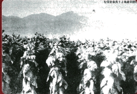
葉たばこ耕作(1930年代)

昭和23年、たばこ祭は、煙草耕作組合連合会の創立25周年にあたり様々な事業が実施され、その一環として始まりました。この時に中山晋平作曲・小島喜一作詞の「たばこ音頭」が作られ、その当時のたばこ耕作者の労をねぎらいました。秦野のたばこ耕作は、江戸初期に始まり、秦野の産業の礎を築きましたが、昭和59年にその耕作の歴史に幕を閉じました。