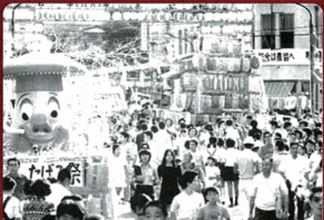
竿灯車パレード(1973年)