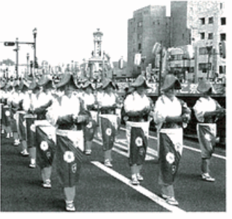
▲たばこ音頭パレード