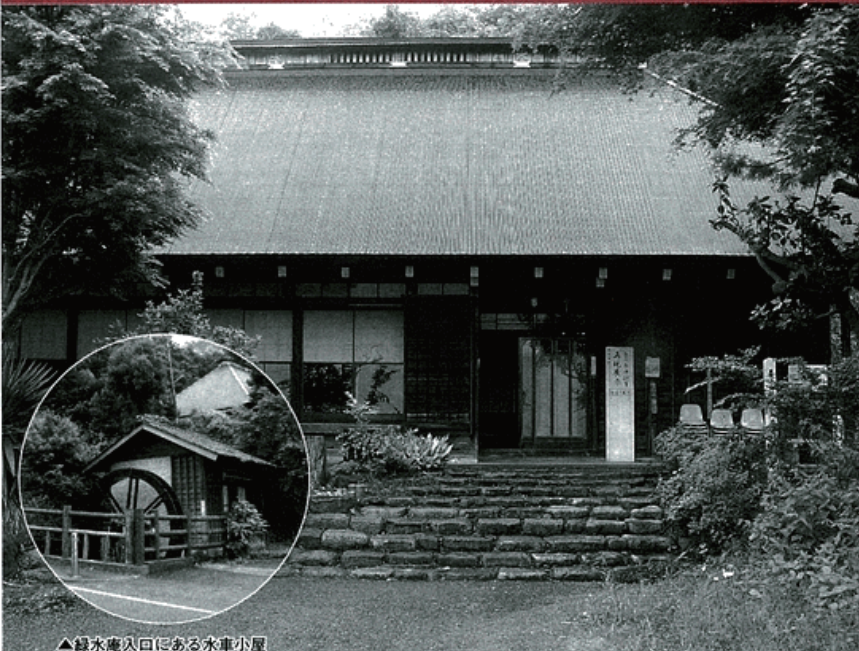
▲緑水庵入口にある水車小屋