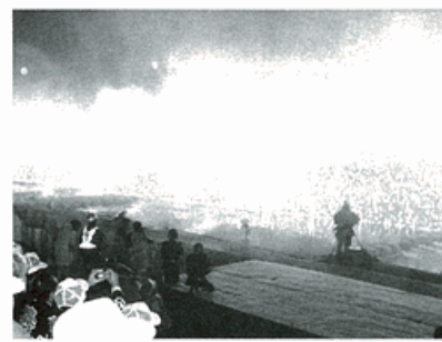
▲フィナーレを飾る仕掛花火・ナイアガラ