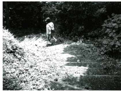
東海大学前駅への下り道

龍法寺から少し行ったところにある「町内会館前」バス停より、オレンジヒル経由東海大学前駅行きのバスに乗り、駅へ向かいます。