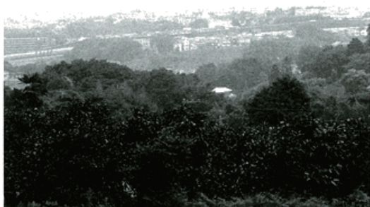
みかん畑より市街地を望む