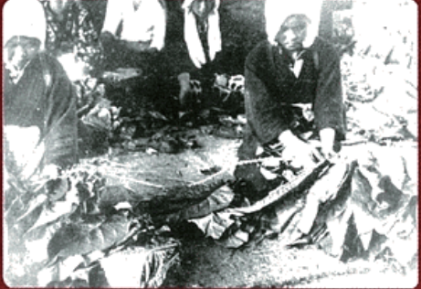
葉たばこ加工作業の様子(1930年代)