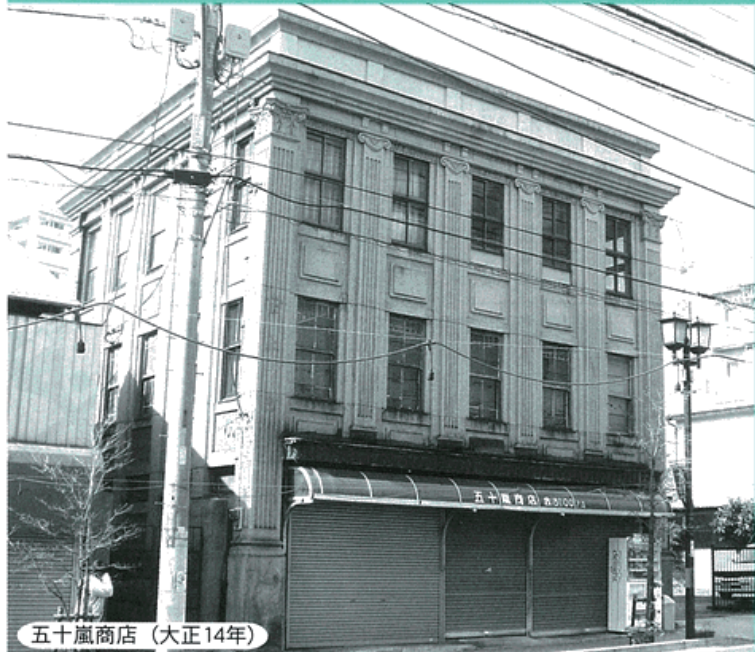
五十嵐商店 (大正14年)