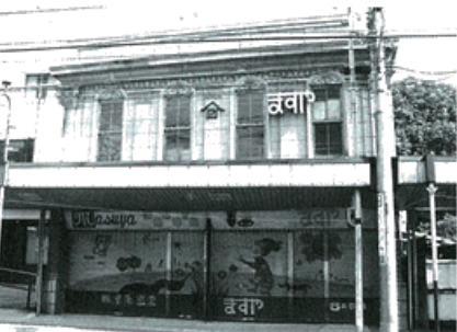
柵屋陶器店 (昭和2年)

進むと、本町四ツ角と言われる大きな十字路があります。その手前100mくらいのところに柵屋陶器店があります。 柵屋陶器店は昭和3年(1928)の建築と伝えられる看板建築です。外壁には柱型が並び、柱型上部のギリシア建築風の柱頭、アカンサスの葉が連続するモールドイング、上部のコーニスなど、洋風の意匠が精巧に形作られています。建物の正面右上の「ますや」のロゴ看板はとても愛嬌があります。洋風の外観は正面のアーケードと「ますや」のロゴがなければ、