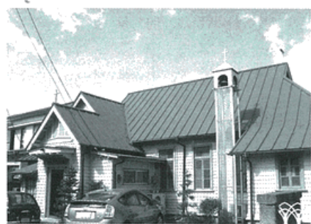
秦野聖ルカ教会 (昭和14年)

四ツ角から見て南東方向にある住宅街の中には秦野聖ルカ教会が、閑静な佇まいで、私たちを迎えてくれます。