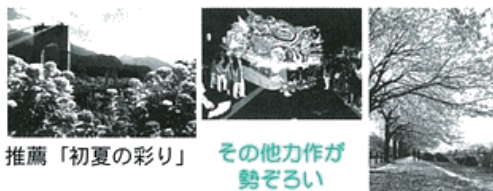
推薦「初夏の彩り」 その他力作が 勢ぞろい