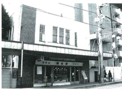
佐野保全堂 (昭和2年)