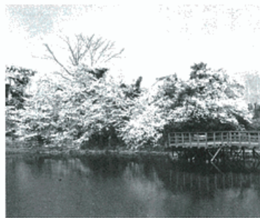
桜咲く今泉名水桜公園

井に組み上げられた木枠と斬新な外観は、伝統と新たな歴史の融合が感じられます。 本堂には秦野市指定重要文化財である「木造十一面観音菩薩立像」が安置されています。