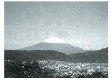
権現山山頂からの富士山

とができます。他にも様々なスポットを紹介して頂いた中で、左の富士山ビューマップを参考に秦野市内富士山めぐりを楽しんではいかがでしょうか。 富士山ビューマップ（A4版・A3版）は、秦野市役所1階ロビー、もしくは西庁舎前コンビニエンスストア内の秦野市観光協会事務局にて配布しております。またA4判は観光協会ホームページからもダウンロードできます。