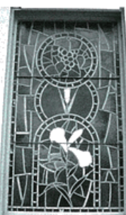
教会のステンドグラス