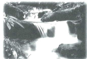
マイナスイオンで満ちあふれる川辺 金目川 養毛橋上流

秦野市は、北に丹沢連峰、南方に洪沢丘陵（大磯丘陵の一部）が東西に走る、県下で唯一の盆地を形成し、丹沢山塊から流れ込む地下水は、「天然の水がめ」といわれる盆地の深層部に3億トン（芦ノ湖の1.5倍に相当する）もの量が蓄えられ、湧水が市内各所から湧出しています。これらを総称して「秦野盆地湧水群」といい、全国名水百選にも選ばれています。