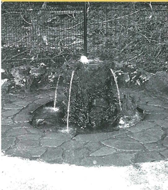
護摩屋敷の水—毎日たくさんの方が訪れる