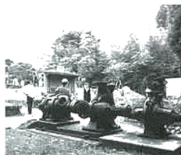
現在の曾屋配水場

江戸時代、曾屋村（現在の本町地区）では、井大明神（現在の曾屋神社）と乳牛水神社の二つの泉水を用水路に流し生活用水にしました。 しかし、人口増加による用水の汚濁や用水路を介したコレラの流行により近代的改良水道が検討され、明治23年3月には、横浜、函館に次いで全国3番目、簡易陶管・自営水道としては日本初の「曾屋区水道」が給水を開始しました。 今も残る曾屋配水場跡地に歴史の一端を垣間見ることが出来ます。