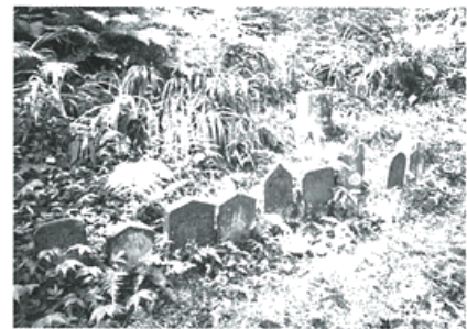
伊勢原の馬頭観音

こは、交通の要衝の跡とされています。現在は、道祖神や古びた石碑があり、伊勢原市の史跡にも指定されています。しかし、この辺りの矢倉沢往還は、国道246号の北側を通っていたとされる説もあり、この箕輪駅跡を通っていたのか、正しいことはわかりません。この付近は、住宅街となり、当時の面影は残っていませんが、少し進むとブロック塀に囲まれたお地蔵さんと、矢倉沢往還を案内する石造りの道標があります。道標に従って歩いて行くと、神