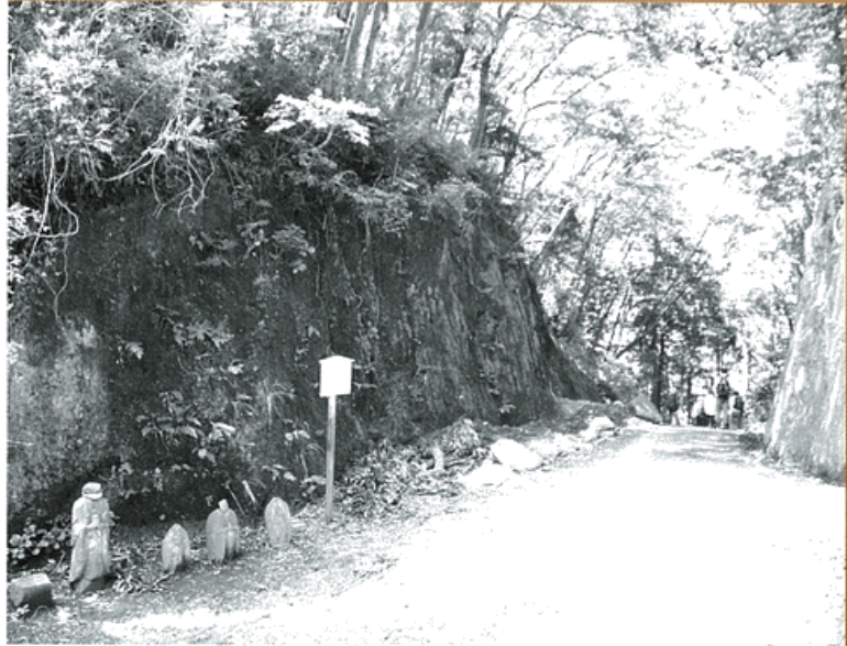
善波峠の切通し この辺りは、当時の面影がしのばれる