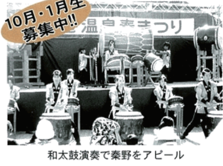
和太鼓演奏で秦野をアピール

平成12年の発足から10年目となります。観光振興のため、年間約50回と多くの市内外のイベントに出演、演奏をしています。 会員は、小学生から70歳までと幅広く、約70名が練習に励んでいます。 あなたも日本の芸能、和太鼓を演奏してみませんか。