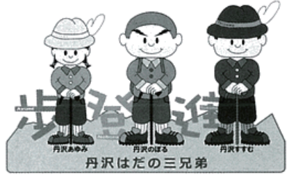
丹沢はだの三兄弟