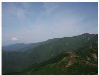
三ノ塔から見た富士山と表尾根

【三ツ目のスタンプ 塔ノ岳の尊仏山荘】 次に紹介するスタンプの場所は、塔ノ岳の山頂にある「尊仏山荘」です。鍋割山荘からは金冷シノ頭を經由して約65分、また大倉から大倉尾根を約3時間登ると塔ノ岳山頂です。山頂にある2階建ての山