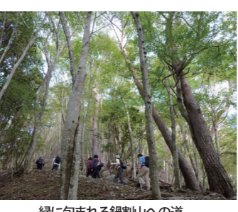
緑に包まれる鍋割山への道

【二ツ目のスタンプ 鍋割山の鍋割山荘】 二ツ目のスタンプ設置場所は鍋割山山頂にある山荘「鍋割山荘」です。鍋割山は大倉のバス停の向かいにある「大倉屋」の脇を進み、二俣―後沢乗越を經由して約3時間20分です。山頂に近づくと、西側の視界が開け、晴れて空気が澄んだ日には富士山がくっきりと見えます。鍋割山荘では評判の名物、「鍋焼きうどん」をご堪能ください。スタンプもお忘れなく。