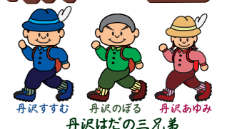
丹沢すずむ 丹沢のぼる 丹沢あゆみ 丹沢だの三兄弟