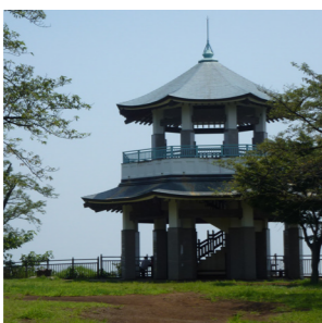
弘法山公園の展望台

細かい道を抜けて弘法山公園へ 健速神社から東名高速道路の上を渡り、弘法山公園を目指します。最初は車の通りが多く、歩道のない道もありますので注意が必要です。 道標のあるポイントで細い道に入り、似たような道の多い住宅街を歩きます。迷いやすいので、注意が必要です。2面の地図と道標を参考に、先に進んでください。 長源寺の手前の分岐は道標が少し奥まったところに設置されているので、見落としがちです。