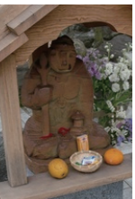
西光寺の毘沙門天

秦野の特産品を使ったクッキーで、ネットショップ、ファミリーマート秦野市役所前店で販売しています。香ばしく、さっくりとした歯ごたえのクッキーぜひご賞味ください。 新規取扱商品情報 ● 山本海苔店 日本橋本店限定 焼海苔実演仕上げ(全型10枚入×2) 1050円 一藻百味 5袋入 1943円 (うめ味・ネギみそ味・明太子味・鮭味・しば漬け味) すびなつおら ホテル用カレー 546円 無農薬 玄米スープ 525円 (株)創健社 丹沢サイダー(1本) 100円 (株)クロウバー 秦野落花生クッキー 420円 丹沢銘茶クッキー 420円 8月にはブルーベリー狩りと白笹うどんでの昼食(七福神うどん)をセットにしたツアーを企画し、好評を得ました。 参加費は3000円前後で昼食と季節に応じた体験企画(さつま取りなど)とセットになっています。10月11日(木)、12日(金)には、落花生掘りもセットになったツアーを実施いたします。 観光協会では、皆様からの要望によるツアーにも企画面でご協力しておりますので、催行のご希望やご相談がありましたら、お気軽にお電話ください。 【お問い合わせ先】 秦野市観光協会 電話 0463 82 8833