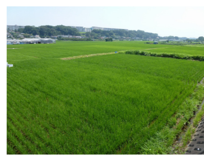
南平橋付近の田園風景

南平橋バス停から蓑毛のバス停まで、秦野市の東部をほぼ縦断するコースです。 田園風景広がる南平橋をスタートし、ソメイヨシノで有名な弘法山公園を通り、古道である大山道などをたどって蓑毛に至る歴史と、自然を満喫できるルートです。