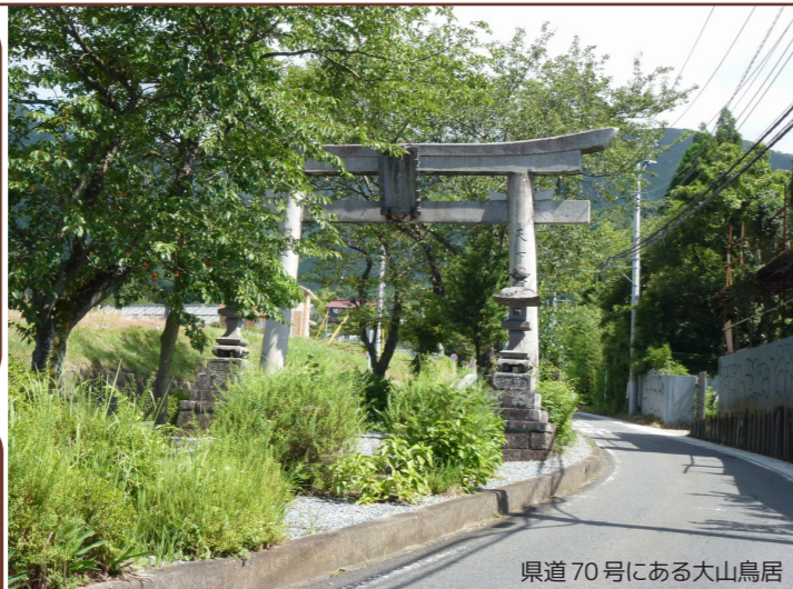
県道70号にある大山鳥居

関東ふれあいの道とは 関東ふれあいの道は、関東の一都六県を巡る総延長1655kmの自然歩道です。 東京都八王子市の梅の木平から関東各地を巡り、美しい自然、田園風景、歴史文化を身近に感じられるように設定されています。 1コースが約10kmで、日帰りができるように始点や終点にはバスや鉄道でアクセスできるようにしています。 秦野市内を通るルートは「15.弘法大師と丹沢へのみち」、「16.大山参り蓑毛のみち」、「9.弘法大師と