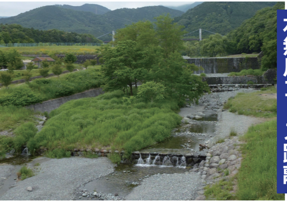
ふれあいの橋から見た風の吊り橋