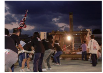
ジャンボ火起こし綱引きコンテスト