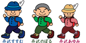
丹沢すずむ 丹沢のぼる 丹沢あゆみ 丹沢はだの三兄弟