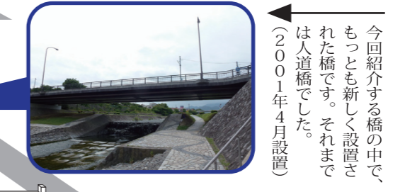
今回紹介する橋の中で、もっとも新しく設置された橋です。それまでは人道橋でした。(2001年4月設置)