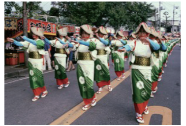
たばこ音頭千人パレード