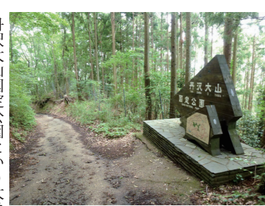
目印となる「丹沢大山国定公園」の看板

黒竜の滝から先は、近くの山道を登ります。下ってきたのと同様の急な坂ですが、急な登坂はここが最後になります。登り切ったところが西山林道で、右側へ進み、ゆるやかな林道を下って行きます。 丹沢大山国定公園という大きな看板が見えてくれば、ゴールはもうすぐ。道標に従って進めば、目的地の秦野戸川公園です。 【裏面にコースの詳しい案内があります】