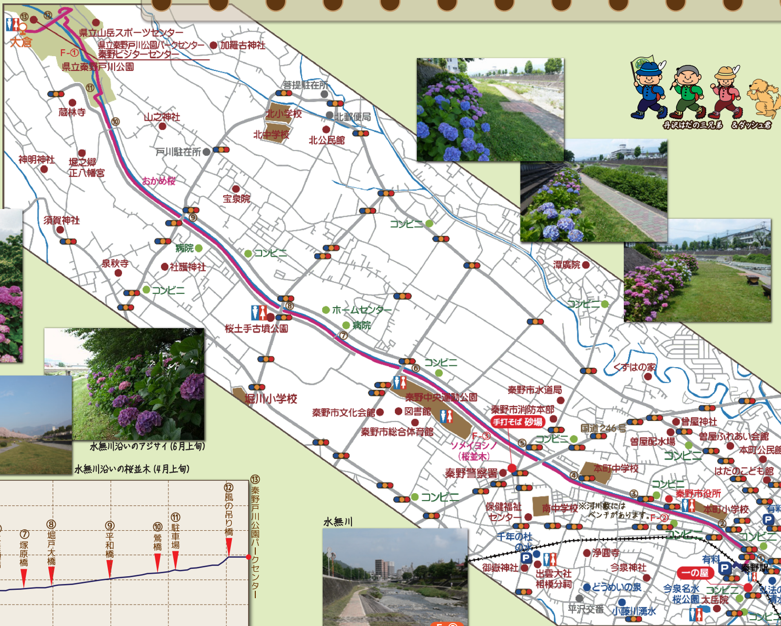
水無川沿いの桜並木(4月上旬)