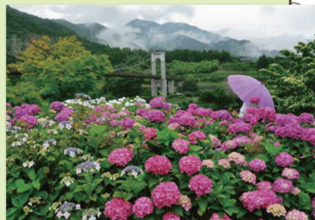
「煙る山に映える花たち」 (秦野戸川公園のアジサイ)