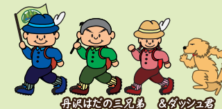
丹沢だの三兄弟 & タンゴウ君