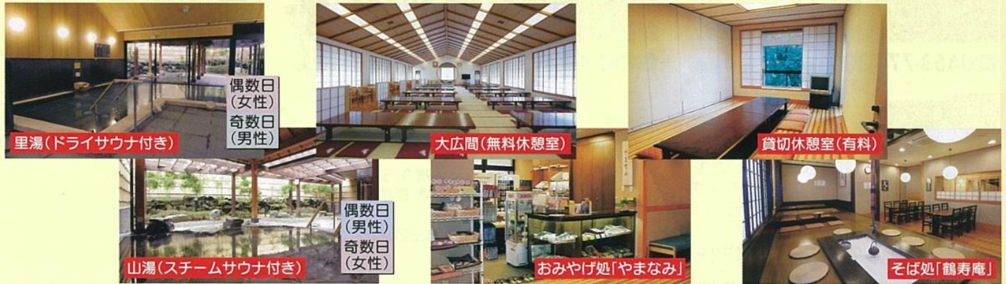
里湯(ドライサウナ付き)